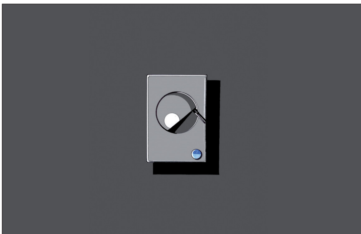
Wandleuchte mit einer 3,5-Watt-LED