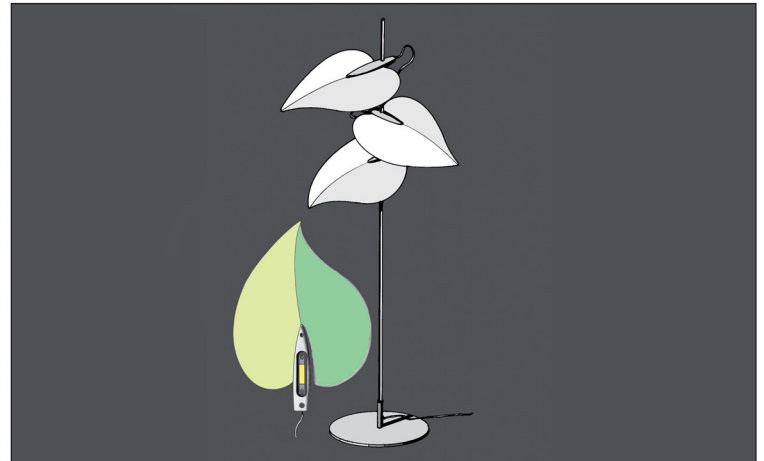
Stehleuchte mit drei 3,5-Watt-LED